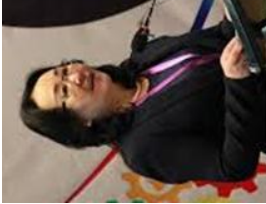
Хүний эрхийн хуульч