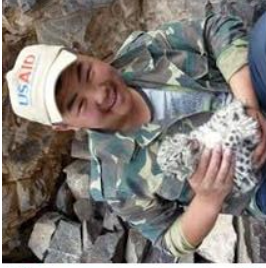
Байгаль орчны тэмцэгч