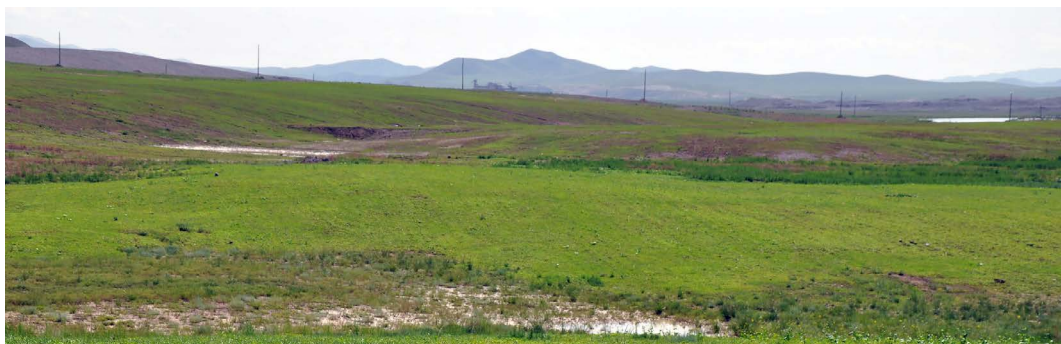
Монполимет ХХК-ны олборлосон талбайдаа хийсэн “Бэлчээрийн нөхөн сэргээлт” 2