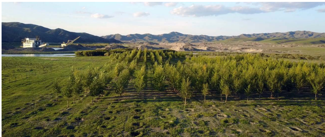
Монполимет ХХК-ны олборлосон талбайдаа хийсэн “Ойжуулалт”-ын нөхөн сэргээлт 1

Энэхүү үйл ажиллагаа нь хаалтын менежментийн төлөвлөгөөний дагуу хийгдэнэ. Уг төлөвлөгөө нь агуулга, хэрэгжилт, хяналтаас хамаарч байгаль орчин нөхөн сэргээгдэх, нутгийн иргэд эрүүл, аюулгүй орчинд амьдрах эсэх асуудал шийдвэрлэгдэнэ.