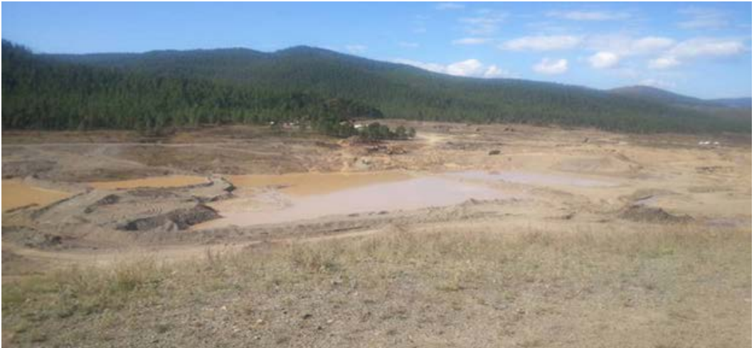
Орхон голын хөндий 2018 он. Архангай аймгийн Цэнхэр сумын Орхон баг.